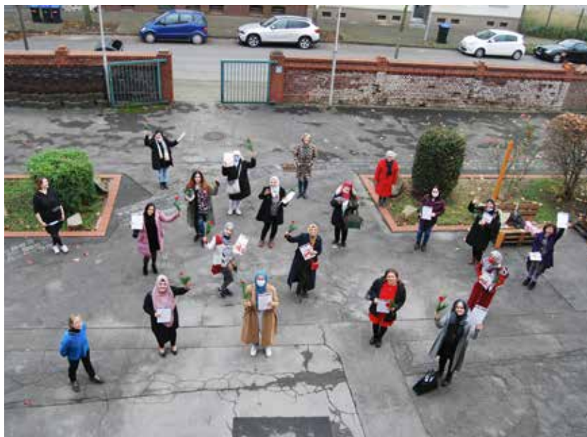
Die neuen Integrationsbegleiterinnen freuen sich über ihre Zeugnisse

Ab Januar 2021 wird das Projekt fortgeführt.