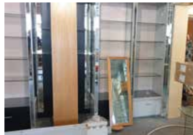
Fertig aufgebaut sieht die Ladeneinrichtung super aus.

danken. Es ist – auch zur Freude unserer Kunden - wunderschön geworden.“