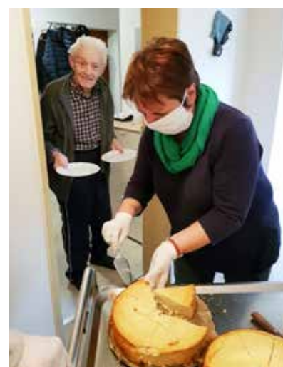
Die Senior*innen freuten sich sehr über die erneute Aktion.

Auf vor den Wohnungen bereit gestellten Tellern kredenzte das Team allen 60 Bewohner*innen neben Kuchen auch hausgemachte Reibekuchen und zauberte so ein Lächeln in deren Gesichter. Tolle Aktion!